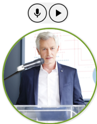
ODCZYT REFERATU PRZEZ NUDNEGO NAUKOWCA